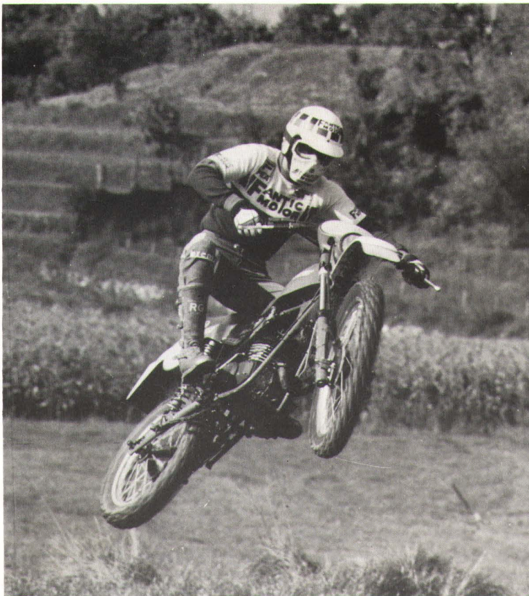
Caballero 50 competizione i aksjon.

I Norge har Fantic sykler fullstendig dominert resultatlistene ved Trialløp. Trial er den vanskeligste form for terrengkjøring som finnes.